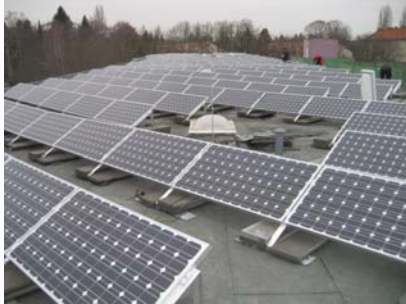
Schulgebäude → Flachdach (82 kW p )