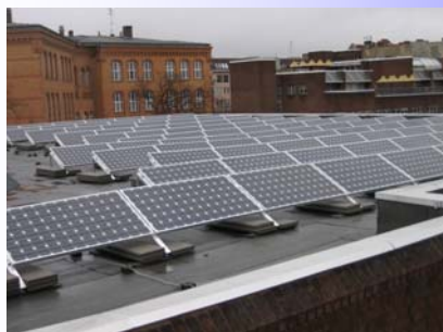
↖ Schulgebäude → Flachdach (42 kW p ) ↗