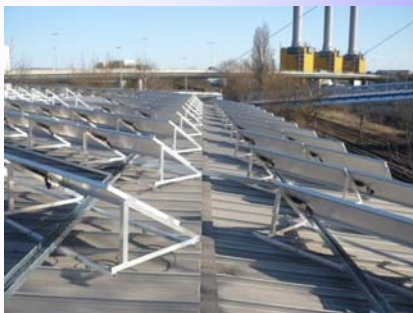
Sporthalle → Kalzip-Dach (60 kW p )