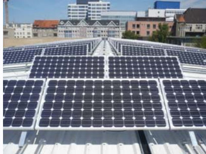
Schulgebäude → Blechdach (65 kW p )