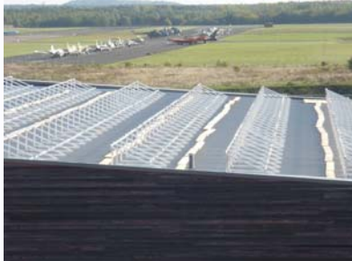
↑ Sporthalle → Kalzip-Dach (114 kW p )