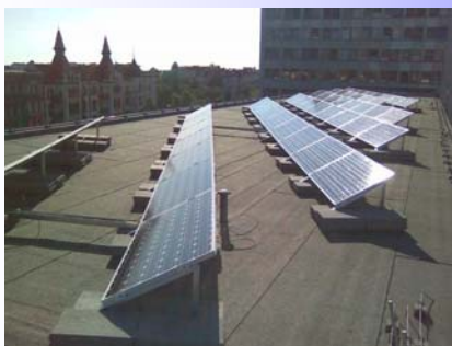
Rathausgebäude → Flachdach (21 kW p )